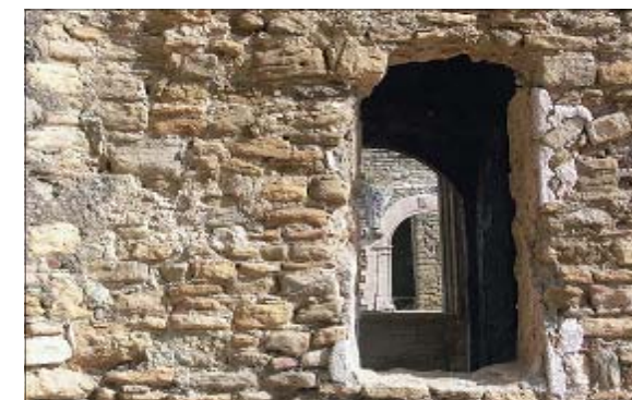
"Porta de la façana posterior de la Col·legiata d'Àger"